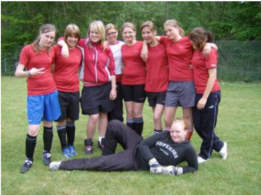
Pigefodboldholdet fra Hellebjergstævnet