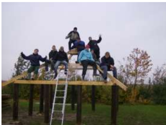
Friluftsholdet bygger bålhytte